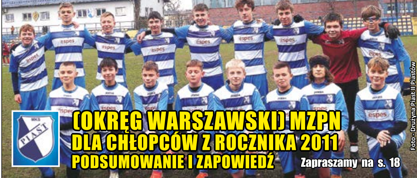
Foto - Drużyna Piast III Piastów